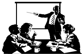
EuroAcustici: formazione e qualificazione professionale del tecnico COMPETENTE e degli SPECIALISTI in ACUSTICA e VIBRAZIONI